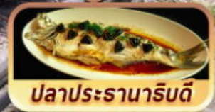
ปลาประจานาริบดี