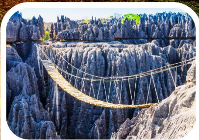
อุทยานแห่งชาติซิงกี เดอ เบอมาราฮา