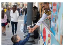
ไอศกรีม Maraş ชมพระอาทิตย์ตกดิน ณ ภูเขาเนมรุต