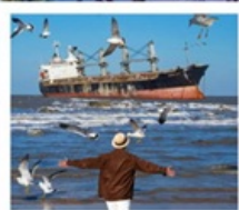
เรือลิวอิส