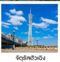
จัตุรัสฮัวเจิง