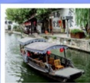
เมืองโบราณหนนสนวิน