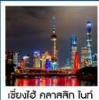
เชียงใหม่ คลาสสิก ไนท์