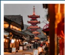
หมู่บ้านเหินยวนฮาวาน