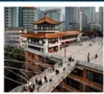
ต้ก 22 ช้บ