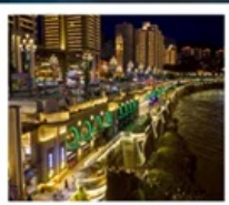
ถนนหนบบบ