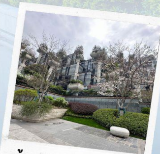
ห้าง Tian AN 1,000