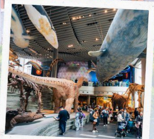
Shanghai Natural history Museum