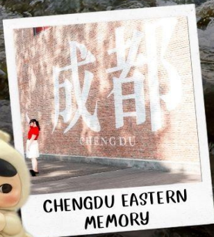
CHENGDU EASTERN MEMORY