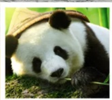
ศูนย์หมีแพนด้า