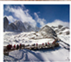
ไร่จรงเม่น้ำเยงซี

ลัดขีตมอว / ไร่จรงเม่น้ำเยงซี / เมืองโบราณเซงกีสล่า / ไร่จรงเม่น้ำเยงซี / ไร่จรงเม่น้ำเยงซี เมืองโบราณรุ่งทอ / ไร่จรงเม่น้ำเยงซี / ไร่จรงเม่น้ำเยงซี / ไร่จรงเม่น้ำเยงซี ไร่จรงเม่น้ำเยงซี / ไร่จรงเม่น้ำเยงซี / ไร่จรงเม่น้ำเยงซี / ไร่จรงเม่น้ำเยงซี