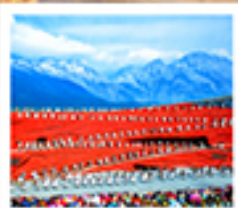
ไร่จรงเม่น้ำเยงซี