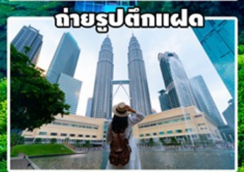
ถ่ายรูปตึกแฝด