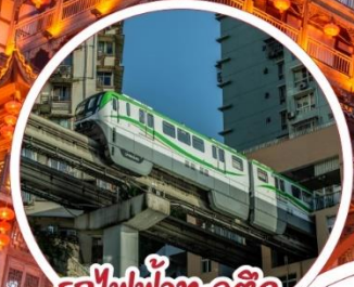
รถไฟฟ้า-ลูตติก Liziba Station