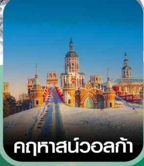
คฤหาสน์วอลกา