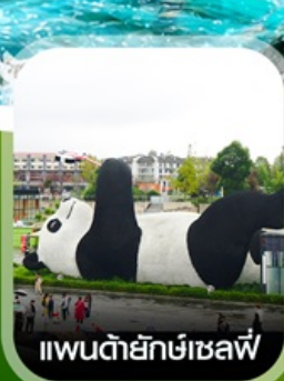
แพนด้ายักษ์เซลฟี่

คอนเฟิร์ม ออกเดินทาง ทุกพีเรียด 2 ท่านขึ้นไป