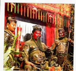
เทพเจ้ากวนอู วัดถุนไถ