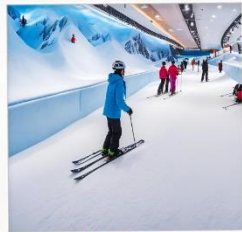
บ้านหิมะ WINDOW OF THE WORLD