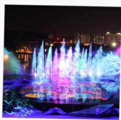
โชว์ม่านน้ำสามมิติ OCT BAY WATER SHOW