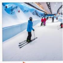
บ้านหิมะ WINDOW OF THE WORLD