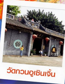
วัดกวนอูเซินเจิ้น