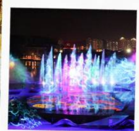
โชว์น้ำสามมิติ OCT BAY WATER SHOW