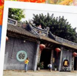
วัดกวนอูเซินเจิ้น