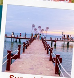
Sunset Sanato Beach Club