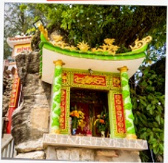
ศาลเจ้าติงซา