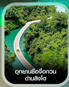
อุทยานซีจื่อกวาน ด่านสิงโต