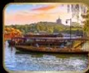
ล่องเรือ ทะเลสาบซีหู