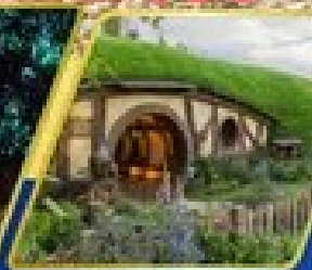
หมู่บ้านฮอบบิต