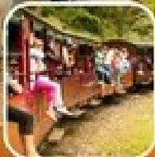
รถไฟหัวกระสุนไปเมลเบิร์น