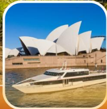
ล่องเรือชมอ่าวซิดนีย์