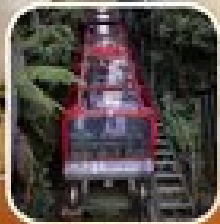
เที่ยวชมอุทยานแห่งชาติ