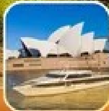
เยือนเมืองซิดนีย์