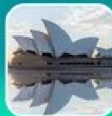
ซิดนีย์ โอลิมปิกพลาซ่า