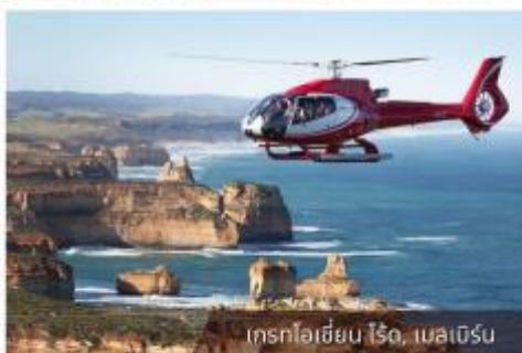
เกรทโอเชียน ไรด์, เมลเบิร์น