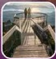
ชมวงเวียนอุลูรู