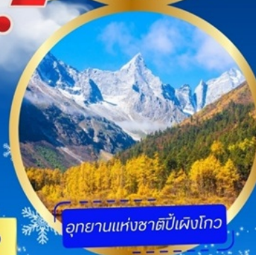
อุทยานแห่งชาติหนีเฟิงโกว