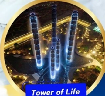
Tower of Life