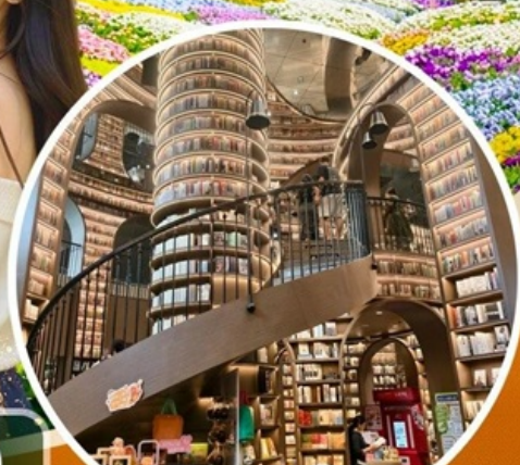
จงซูเก๋อ