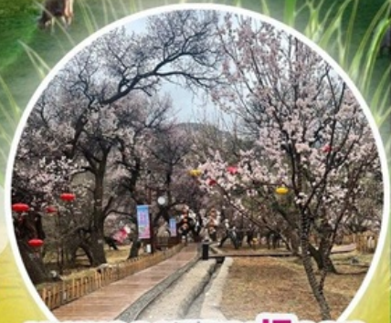
หุบเขาดอกแอปเปิ้ล

ทุ่งหญ้าซิลามูเหริน - พิธีการขอพรจากโอเวบา - ปาร์ตี้กองไฟ - หมู่บ้านชนเผ่ามองโกล สวนวัฒนธรรมมองโกลเหมิงเสียง - หุบเขาดอกแอปเปิ้ล - ทะเลทรายอินเคินทาลา แหล่งวัฒนธรรมมองโกลหยวนหลิว (รวมรถกอล์ฟ 2 ขา) - ตลาดกลางคืนเจียไท่ สวนวัฒนธรรมการแต่งงานสุดเอ็กซ์คลูซีฟแห่งเดียวในประเทศจีน บ้านองค์ปฐม - เขตการท่องเที่ยวเจงกิสข่าน-ถนนคนเดินคังปาซ้อ