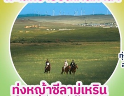
ทุ่งหญ้าซิลามูเหริน