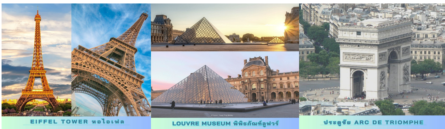
EIFFEL TOWER หอไอเฟล

นำท่าน ชมหอไอเฟล (EIFFEL TOWER) ซึ่งเป็นสัญลักษณ์ของกรุงปารีส เลิศหรู อลังการ โรแมนติค มหัตศจรรย์ ด้วยความสูง 984 ฟุต สร้างด้วยโครงเหล็กทั้งหมด...ถนนของเซลิเซ (CHAMPS-ELYSEES) ถนนที่มีต้นไม้เรียงรายทั้งสองข้างทางอย่างน่าเดินเล่น ต้นแบบถนนราชดำเนิน ปลีซเดอลา ค็องคอร์ด (PLACE DE LA CONCORDE) จตุรัสแห่งความสามัคคี โบสถ์แมดดีแลน ที่สร้างแบบกรีกโบราณ ถ่ายรูปกับปิระมิดหน้าพิพิธภัณฑ์ลูฟวร์ หรืออดีตพระราชวังลูฟวร์ จากนั้นนำท่าน ชมเมืองปารีส มหาราชินีแห่งเมืองหลวงของโลก ..ถ่ายรูปคู่กับประตูชัย (ARC DE TRIOMPHE) ของพระเจ้านโปเลียนอาร์ค เดอทร็อม ให้ท่านช้อปปิ้งสินค้าแบรนด์เนมที่มีชื่อเสียง ณ ห้างแกลอรี่ลาฟาแยส เช่น หลุยส์,