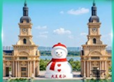
ตึกตาสหะยักซ์ ฮาร์บิน