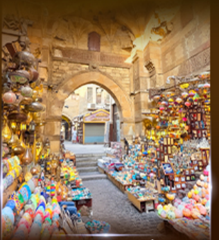
ตลาดห่านเอลคาลี