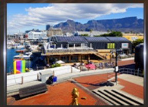
ท่าเรือ V&A waterfront