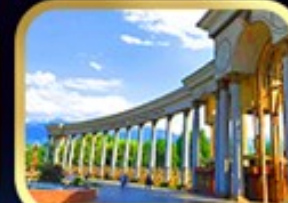
1st President Park