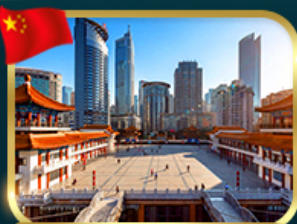
เข็คอินตึกไคว่ซังโหล