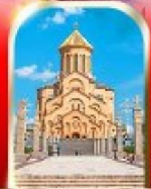
HOLY TRINITY CATHEDRAL