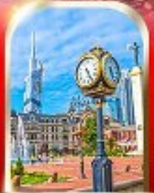
BATUMI CITY ADJARA

เมืองถ้ำอูพลิสซิค ■ ป้อมอนาบูชิ ■ นั่งกระเช้าชมเมืองบอร์โจมี