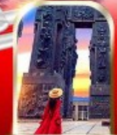
THE CHRONICLE OF GEORGIA