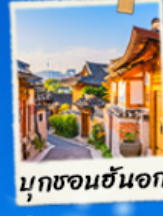
มุกซอนฮันอก