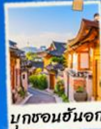
มุกซอนฮันอก