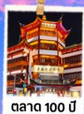
ตลาด 100 ปี