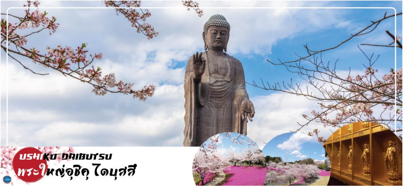
USHIKU ไดบุสสุ พระใหญ่อุซึกุ ไดบุสสี

วันที่สี่ เมืองนาริตะ – เมืองอิบารากิ – พระใหญ่อุซึกุ ไดบุสสี – ตลาดปลาโออาริ – ศาลเจ้าโออาริโซซากิ – เสาศิรินแห่งคามิอิโซะ – เมืองนาริตะ – อีออน มอลล์ – ท่าอากาศยานนานาชาตินาริตะ