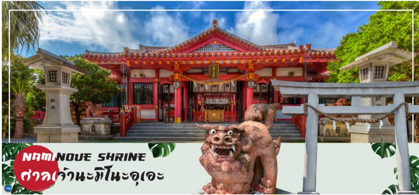
NAMINOUE SHRINE ศาลเจ้ามิโนะอุเอะ

เช้า รับประทานอาหารเช้า ณ ห้องอาหารของโรงแรม (5) นำท่านเดินทางสู่ ศาลเจ้านามิโนะอุเอะ (Naminoue Shrine) (ใช้เวลาเดินทางประมาณ 10 นาที) ตั้งอยู่ ณ บริเวณที่เป็นพื้นที่ศักดิ์สิทธิ์ที่ใช้ในการสวดภาวนาอธิษฐานต่อเทพเจ้าที่สถิตย์อยู่ ณ อาณาจักรเจ้าสมุทรโพ้นทะเลมาแต่ครั้งโบราณ ในอดีตชาวเรือที่เข้าออก ณ ท่าเรือนาสะ (Naha Port) ซึ่งขณะนั้นเป็นศูนย์กลางการแลกเปลี่ยนค้าขายกับนานาประเทศ ทั้งจีน ประเทศทางตอนใต้ เกาหลี และชวายามาโตะ มักจะแหงนหน้ามองขึ้นไปยังศาลเจ้าซึ่งตั้งอยู่บนหน้าผาสูงเพื่ออธิษฐาน และแสดงความขอบคุณ ศาลเจ้านามิโนะอุเอะได้รับความเสียหายจากการรบในโอกินาวะ (Battle of Okinawa) เมื่อครั้งสงครามแปซิฟิก แต่ได้รับการบูรณะฟื้นฟูในเวลาต่อมาเมื่อสงครามสิ้นสุดลง ปัจจุบันนี้ได้กลายมาเป็นศูนย์กลางแห่งศาสนาชินโตในจังหวัดโอกินาวะ ชาวญี่ปุ่นมักจะมาไหว้ขอพรเกี่ยวกับธุรกิจการงานให้เจริญรุ่งเรือง ร่ำรวย และมาสะเดาะเคราะห์ให้พ้นโชคร้าย จากนั้นนำท่านสู่ เอาท์เล็ตมอลล์ อาชิบิโน่า (Okinawa Outlet Mall Ashibinaa) (ใช้เวลาเดินทางประมาณ 30 นาที) เอาท์เล็ทแห่งแรกในโอกินาวะ รวบรวมร้านค้าชั้นนำกว่า 100 ร้าน ทั้งเสื้อผ้าแฟชั่น สินค้าแบรนด์เนม นาฬิกา ข้าวของเครื่องใช้ ของเล่น ทุกร้านจัดเต็มทั้งสินค้านำเข้าและรุ่นใหม่ ลดราคากระหน่ำกว่า 30-80% ให้ได้เดินช้อปปิ้งท้ายทวีปกันอย่างจุใจ ภายใต้บรรยากาศสบายๆ สไตล์รีสอร์ทริมทะเล หากช้อปปิ้งเหนื่อยสามารถขึ้นไปทานอาหารที่ชั้น 2 มีอีกหลายร้านที่คอยให้บริการ