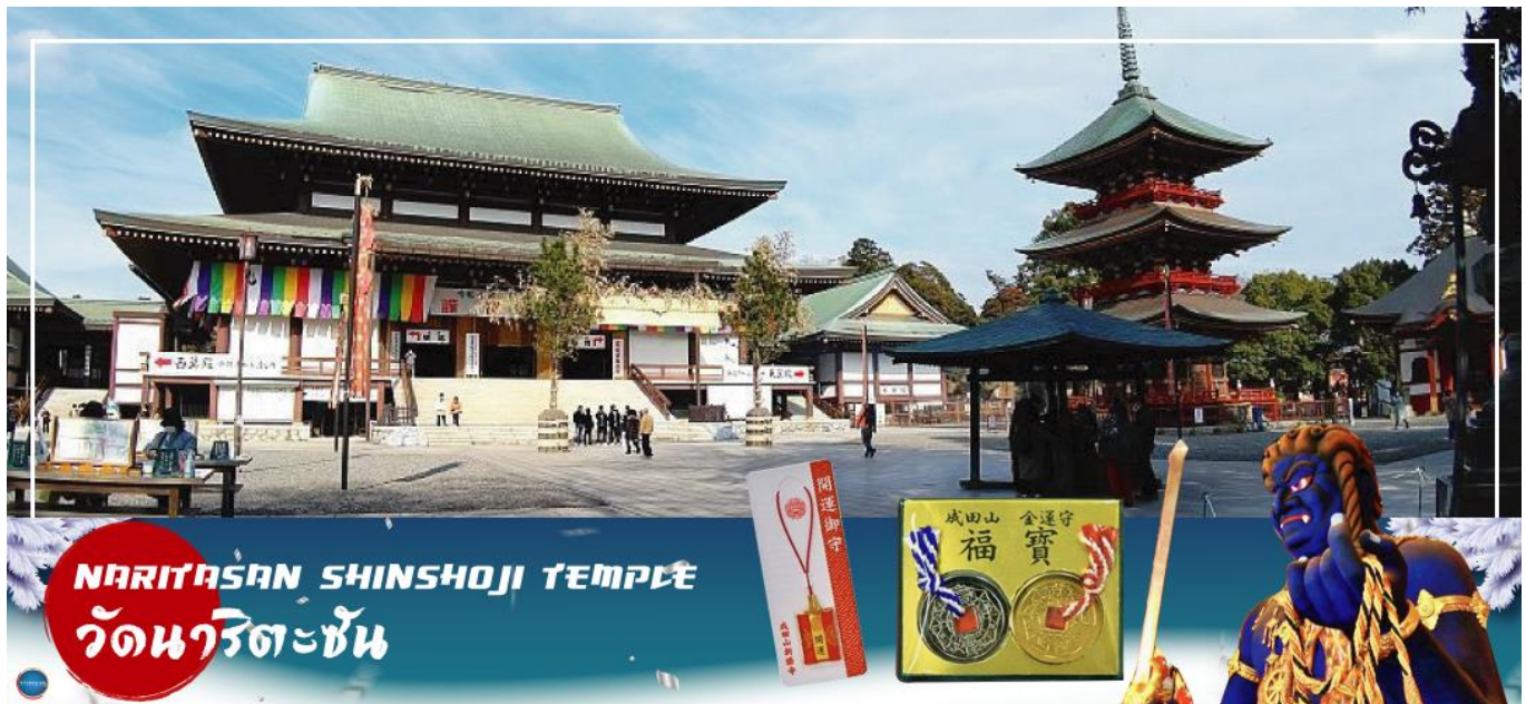
NARITASAN SHINSHOJI TEMPLE วัดนาริตะชิน

เมืองนาริตะ – วัดนาริตะชิน – ถนนปลาไหล โอโมเตะซังโตะ – ย่านโอโตะบะ – ห้างไดเวอร์ซิตี – ท่าอากาศยานนานาชาตินาริตะ