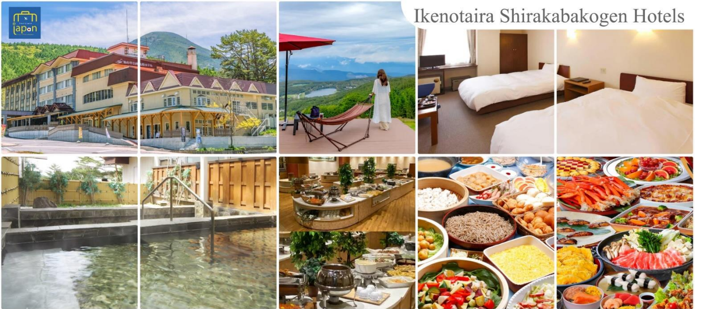
Ikenotaira Shirakabakogen Hotels

หลังอาหารให้ท่านได้ผ่อนคลายกับการแช่น้ำแร่ธรรมชาติ เชื่อว่าถ้าได้แช่น้ำแร่แล้ว จะทำให้ ผิวพรรณสวยงามและช่วยให้ระบบหมุนเวียนโลหิตดีขึ้น