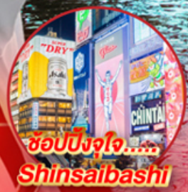
ช้อปปิ้งใจ..... Shinsaibashi