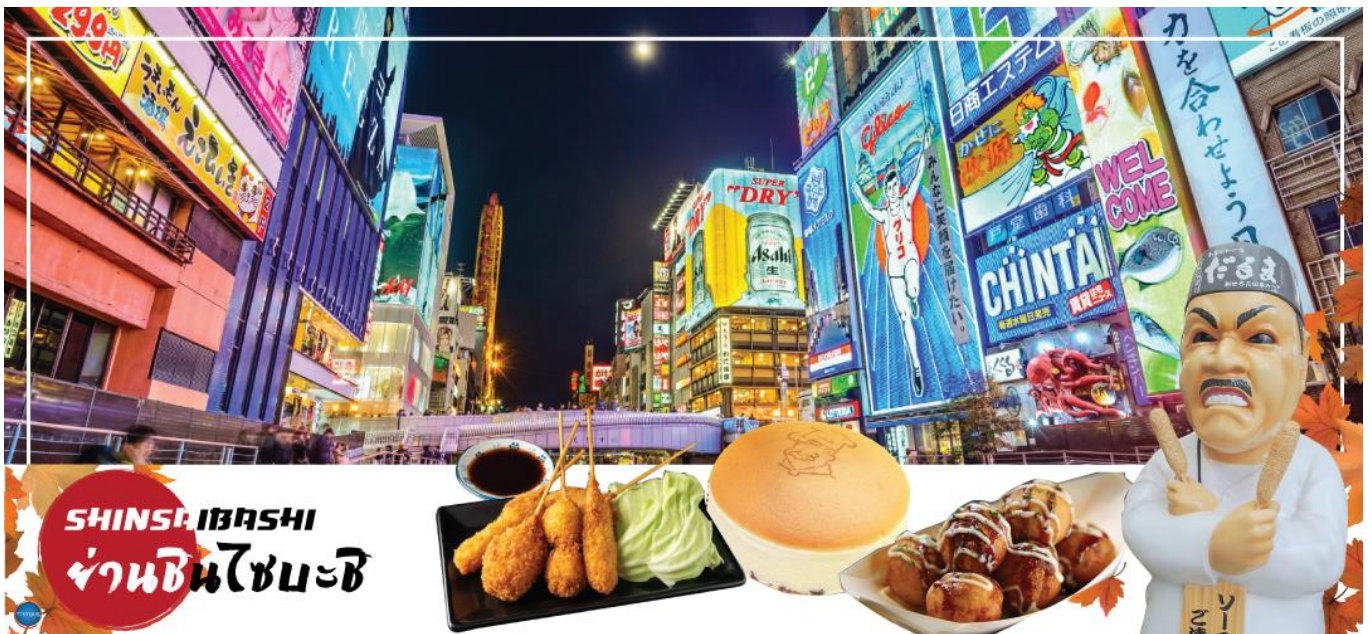
เย็น อิสระรับประทานอาหารเย็นตามอัธยาศัย

จากนั้นอิสระช้อปปิ้ง ย่านชินไซบาชิ (Shinsaibashi) (ใช้เวลาเดินทางประมาณ 1 ชั่วโมง) บริเวณแหล่งช้อปปิ้งแห่งนี้มีความยาวประมาณ 600 เมตร เต็มไปด้วยร้านค้าปลีก ร้านแฟชั่น ร้านเครื่องสำอางค์ ร้านรองเท้า กระเป๋า นาฬิกา ร้านกาแฟ ร้านอาหาร ร้านขนม ร้านเสื้อผ้าสตรีทแบรนด์ ทั้งญี่ปุ่นและต่างประเทศ เช่น Zara H&M Beans ABC Mart เป็นต้น เรียกว่ามีทุกอย่างที่ต้องการ รวมกันอยู่บริเวณนี้ ใกล้กันท่านสามารถเดินไปยัง ย่านโดทงโบริ (Dotonbori) ย่านบันเทิงยามค่ำ คินดอลอดแนวถนนเลียบบคลองโดทงโบริ จากสะพานโดทงโบริบาชิไปจนถึงสะพานนิปปอนบาชิ ไฮไลท์!!! ใครๆ ก็เชิดฉิ่ง ถ่ายภาพคู่ ป้ายกูลิโกะแมน หรือ ป้ายโดทงโบริกูลิโกะ (Dotonbori Glico Sign) เป็นป้ายไฟนีออนรูปนักกรีฑากำลังวิ่งอยู่บนลู่วิ่ง ซึ่งถูกติดตั้งมาตั้งแต่ ปี ค.ศ.1935 นอกจากนี้ยังมีอีกหนึ่งสัญลักษณ์สถานที่นัดพบกันหลง นั่นก็คือ ร้านปูคานิดอรากุ (Kani Doraku) ซึ่งมีป๊อปปูล่าร์และลูกค้าได้อีกด้วย และห้ามพลาดสำหรับ ทาโกยากิ อาหารท้องถิ่นของชาวโอซาก้า ที่มาถึงถิ่นแล้วต้องลอง Original Taste รับรองไม่ผิดหวังแน่นอน