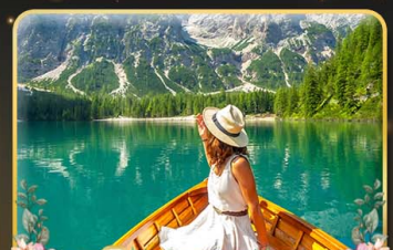
พายเรือทะเลสาบ Braies