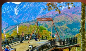
ฮาคุบะอิวาทากะ