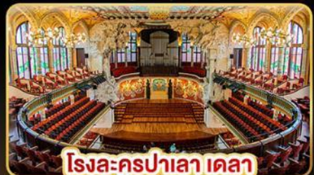
โรงละครปาเลา เดลา มูสิกา คาทาลานา