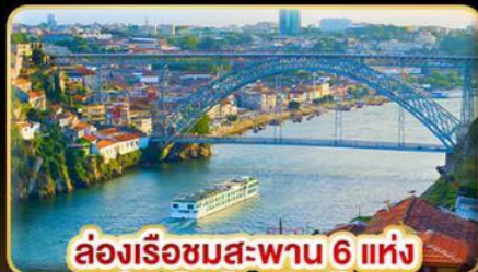
ล่องเรือชมสะพาน 6 แห่ง ในคูโรเมืองปอร์โต