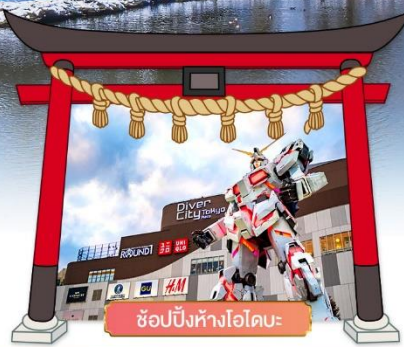
ช้อปปิ้งห้างไอโอบะ