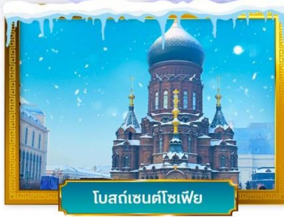
โบสถ์เซนต์ไอแซค