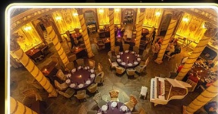
ทานอาหารสุดหรู ภัตตาคาร Turandot