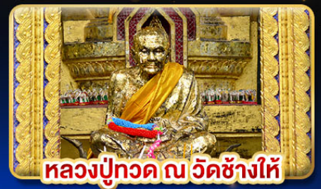
หลวงปู่ทวด ณ วัดช้างให้