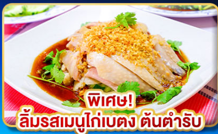
พิเศษ! ลิ้มรสเมนูไก่เบตง ดินดำริบ