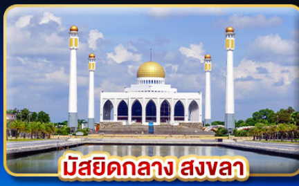
มัสยิดกลาง สงขลา