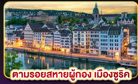
ตามรอยสหายผู้ทอง เมืองซูริค