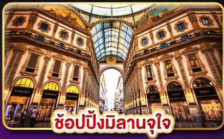
ช้อปปิ้งมิลานจุใจ

📅 เดินทาง : 9-16 ก.พ. / 9-16 มี.ค. / 23-30 มี.ค. 68